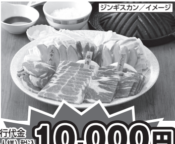
ジンギスカン/イメージ

旅行代金(お一人様)税込 10,000円 割引後旅行代金 お支払い実額(お一人様) 5,000円