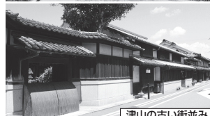
津山の古い街並み