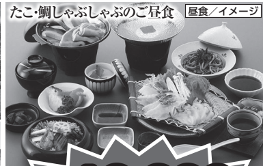
たこ・鯛しゃぶ・しゃぶのご昼食 昼食/イメージ

旅行代金(お一人様)税込 10,000円 割引後旅行代金 お支払い実額(お一人様) 5,000円