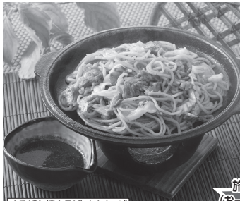
ひるぜん焼きそば/イメージ