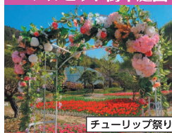
チューリップ祭り