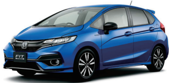
フィットハイブリット(EAクラス/一例)