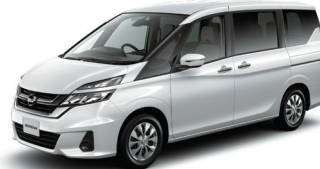
セレナ(WAクラス/一例)