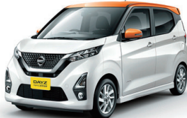
新型デイズ(SKクラス/一例)